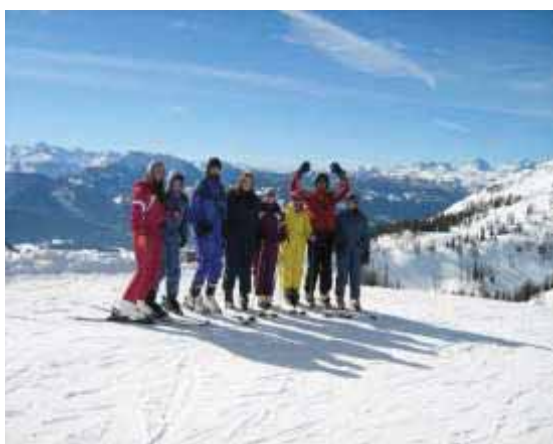
Sí táborban a legjobbak