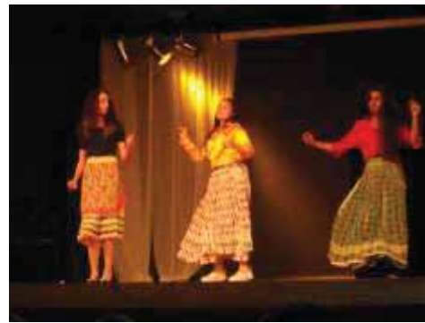
Művészeti fesztiválon 1.