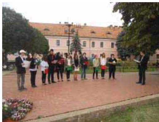
Október 6-ai megemlékezés