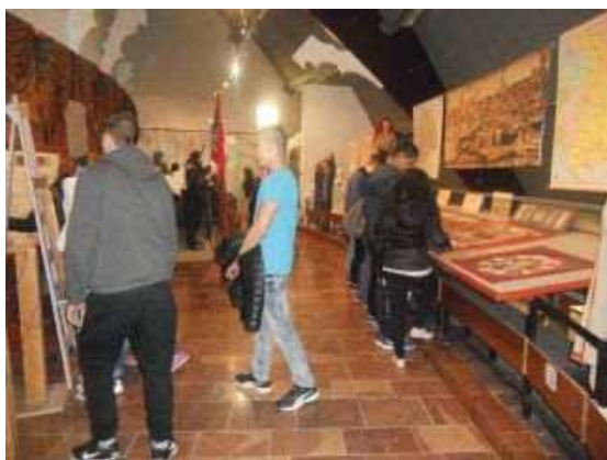
10-11. évfolyam: Szeged-Ópusztaszer

„Minden évben többször lehetőségünk volt tanulmányi kirándulásra menni, ez nem történt most sem másképp. Mostani utunk Ópusztaszerre, Hódmezővásárhelyre és Szegedre vezetett. Nagyon sok örömteli pillanatban volt részünk, és sok szép dolgot láttunk, reméljük, hogy a következő kirándulás is ilyen jó lesz.” (10. évf.)