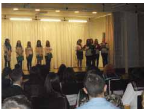
Március 15-ei műsor