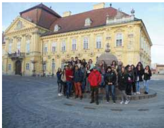
9. és 12. évfolyam: Székesfehérvár

„Elérkezett a várva-várt nap, végre 1 év elteltével részt vehettünk kulturális hétvégén. Mivel ez volt az első alkalom, hogy a 9. és a 12. évfolyam közösen töltött el egy teljes hétvégét, kíváncsian vártuk, hogy működik majd együtt a csapat. Nos, jól vizsgázott a közösség.” (12. évf.)