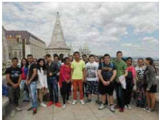
Előkészítő osztály: Budapest