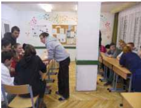
Vetélkedő a Magyar Kultúra Napján