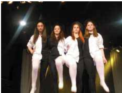
Művészeti fesztiválon 2.