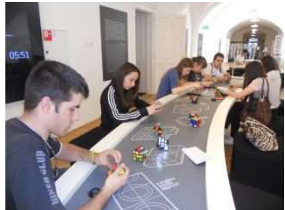
Interaktív kiállítás a budapesti Magyarság Házában