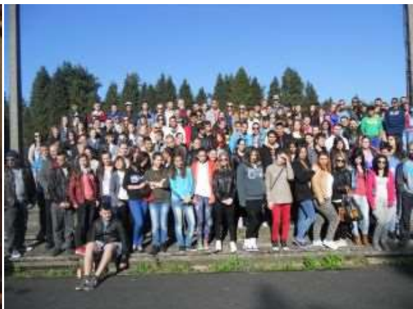
Országos Művészeti Fesztivál